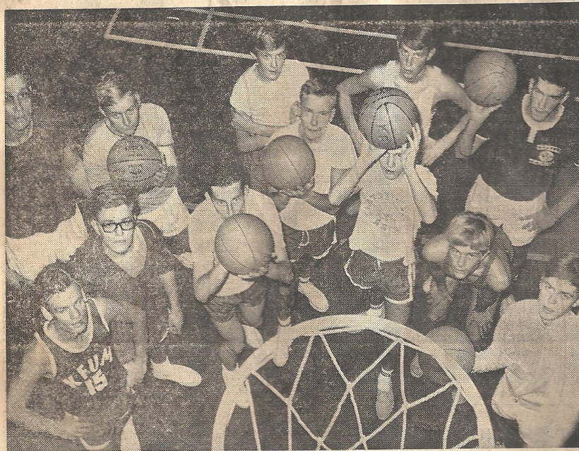
★ Här har vi KFUM Kristianstads basketgång som siktar högt inför den stundande seriestarten i div. III.